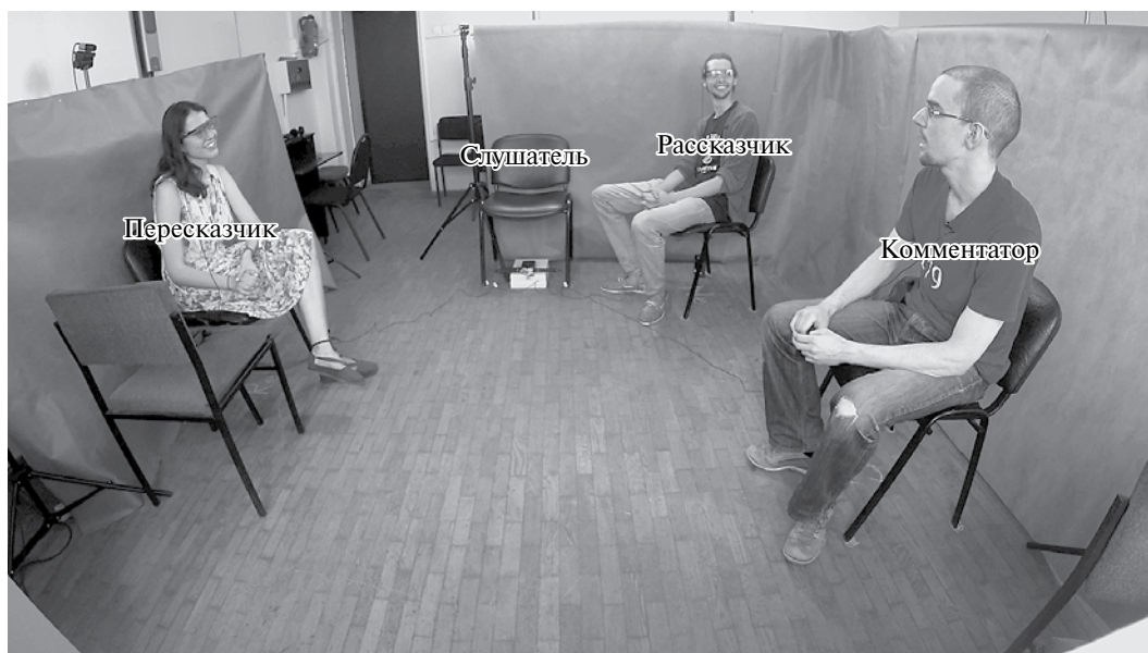
Рис. 1. Общий дизайн коммуникативной ситуации.

себя как превосходный способ получать компактные и сравнимые между собой пересказы.