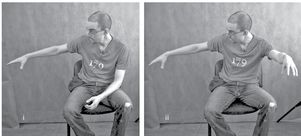
Рис. 3. Жесты, сопровождающие речь из фрагмента (2).

точки отсчета. Нередко встречаются особые фонации, например “скрипучий” голос, который представляет собой своеобразную артикуляционную позу, в рамках которой как сегментные, так и просодические единицы реализуются специфическим образом.